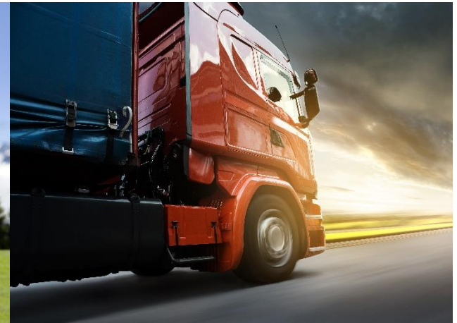
Nutzfahrzeuge und Transport