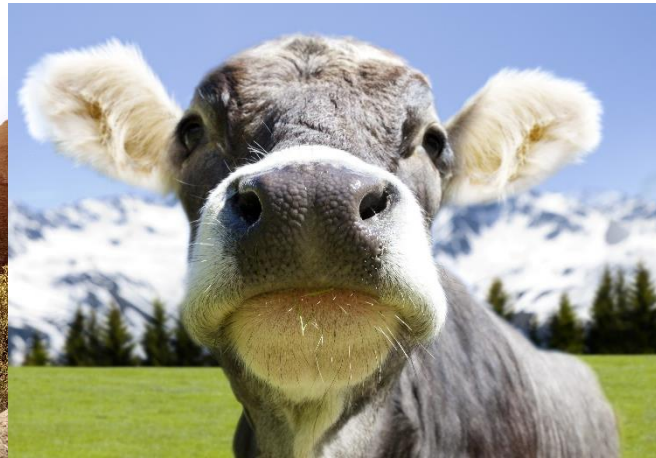
Land- und Forstwirtschaft