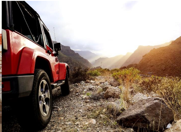
Pkw und AdBlue®